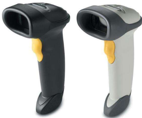
Symbol Motorola LS2208 1

Voor het gebruik van een barcodescanner adviseren wij de Symbol Motorola LS2208.