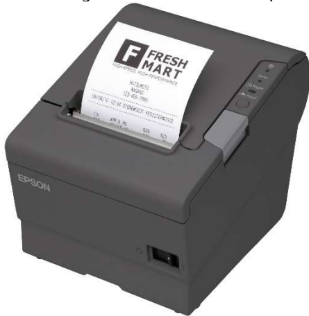
Epson TM-T88V 1

Voor het gebruik van een kassaprinter adviseren wij de Epson TM-T88V.