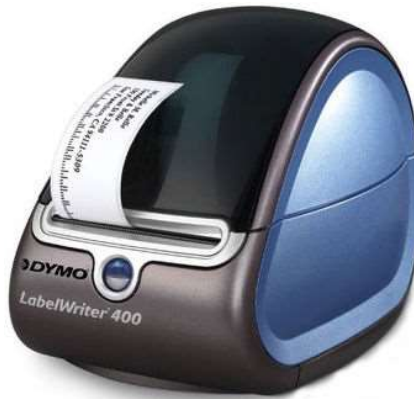
Dymo Labelwriter 400