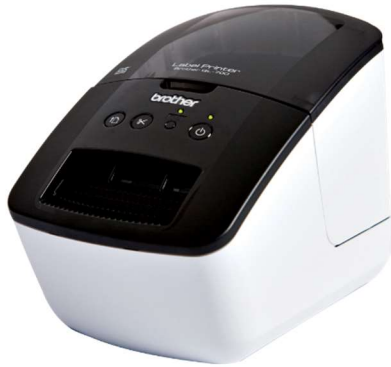
Brother QL-700 labelwriter 1

Als labelprinter adviseren wij de Brother QL-700 labelwriter of de Dymo Labelwriter 400.