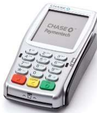
Vx820 PINpad 1