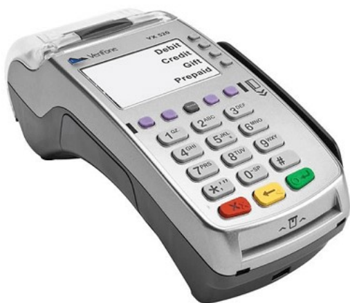
Vx520 cashier unit 1

Voor het gebruik van de CCV-koppeling moeten de volgende apparaten worden gebruikt. Vx520 cashier unit + Vx820 PINpad. Andere apparaten worden hierbij niet ondersteund.